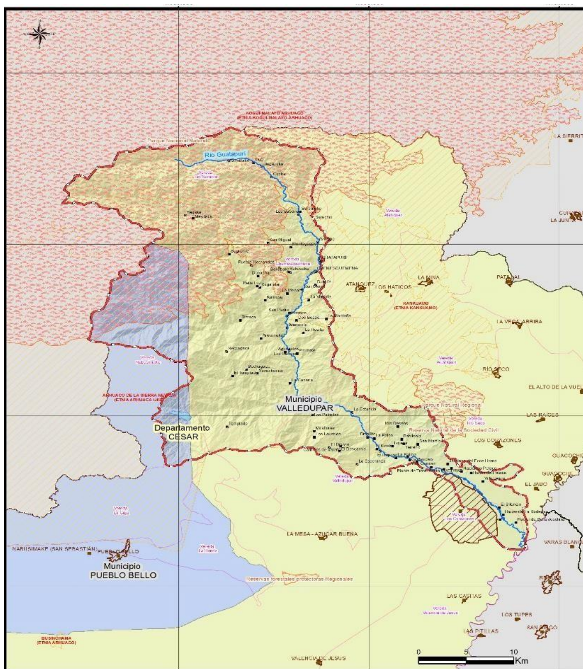
Cuenca río Guatapurí.

En cuanto a las temperaturas, según los datos acumulados desde 1969 por el IDEAM en su estación meteorológica ubicada en el aeropuerto Alfonso López, la temperatura media anual es de 28,4 °C, con mínimas y máximas de 22 °C y 34 °C respectivamente. El mes más caluroso es abril con un promedio de 30 °C y el más fresco es octubre con 26 °C.